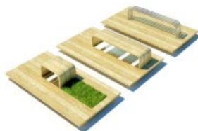
SEDUTE iverde supporto metallico lampada alogena letrisco supporto metallico lampada alogena iutobolari supporto metallico lampada LED