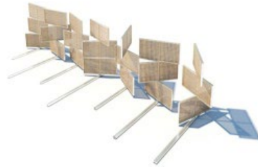
PARETI MOBILI Pannelli in grigliato metallico con perno centrale che si muovono col vento