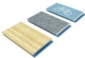
PAVIMENTAZIONE Igdonale doghe in legno ricostruito e resina igico mateco con inerti trasparenti icidabile mateco