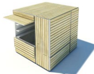
COMMERCIO Struttura metallica e rivestimento in legno: può ospitare attività commerciali permanenti o stagionali