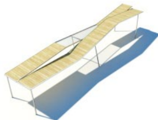
TETTOIA tettoia pannelli in legno su supporto metallico